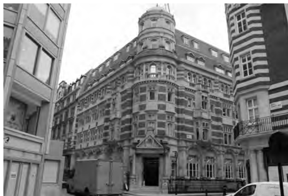
Abb. 12: In diesem Haus in der Londoner Ryder Street waren Büros des SIS angesiedelt, darunter die Section V von Kim Philby.

war immer entspannt und durch nichts zu erschüttern. Er führte zu dieser Zeit natürlich denselben Krieg wie seine Kollegen: Der extreme Stress muss später gekommen sein, als er eine neue Sektion organisierte, um russische Spionage abzuwehren – aber auch wenn er nun einen etwas anderen Krieg führte, behielt er seinen Handwerker-Stolz.“ 69