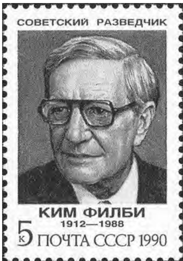
Abb. 11: 1990 wurde in der Sowjetunion eine Briefmarke mit dem Porträt Kim Philbys herausgegeben.