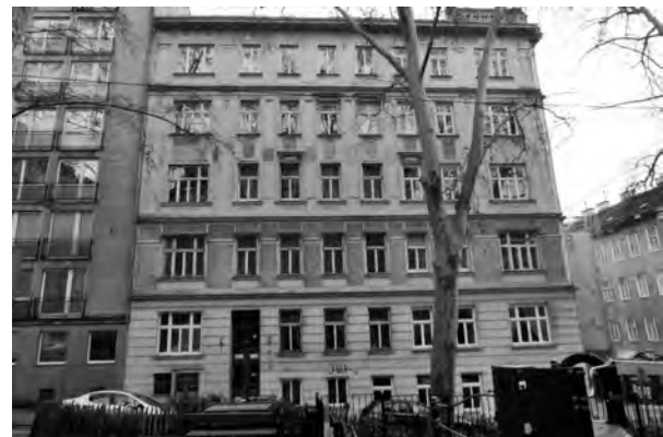
Abb. 9: Heutige Ansicht des Hauses Latschkagasse Nr. 9.