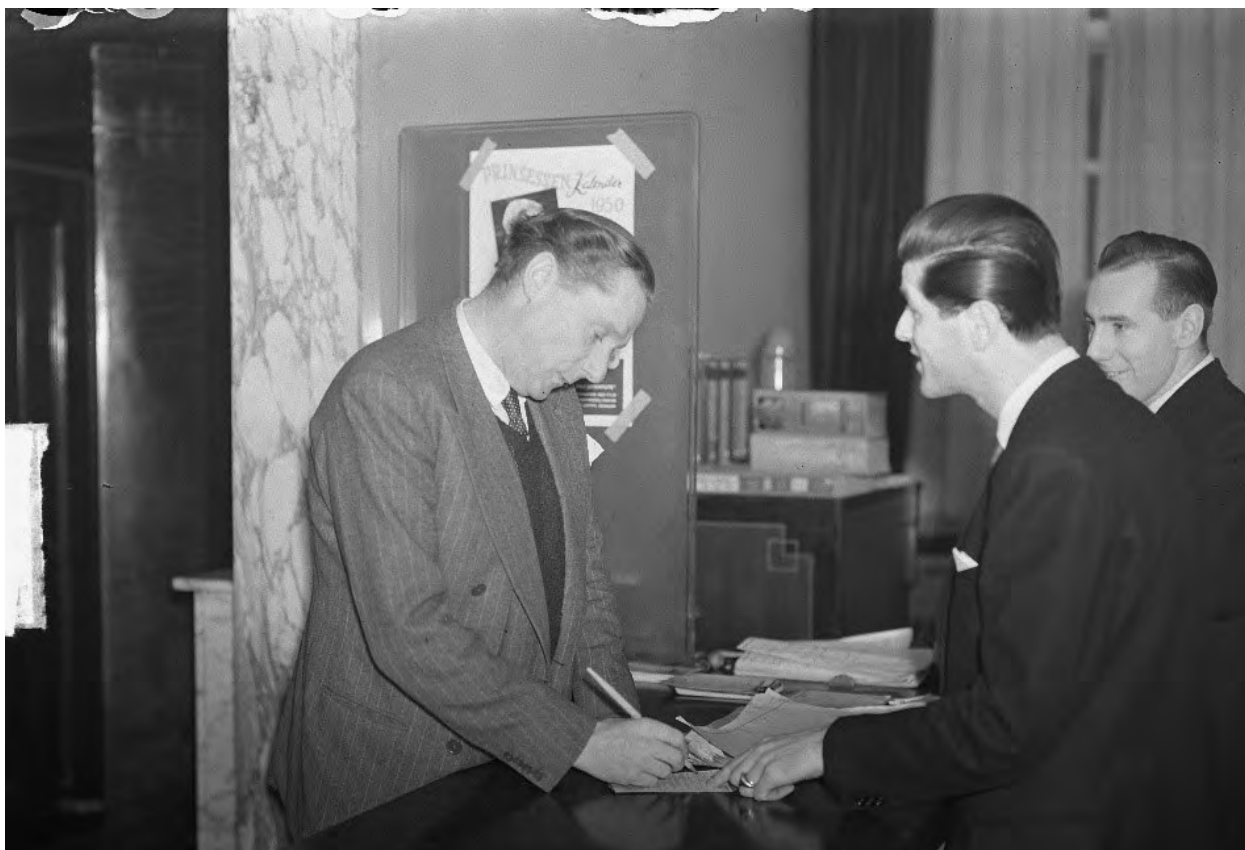
Abb. 14: Carol Reed 1950 in Amsterdam.

Im Juni 1948 war Greene ein zweites Mal in Wien. Diesmal blieb er für 20 Tage (10. bis 30. Juni). „Lange Nächte, viel Trinken, viel Schreiben“ („Late nights, hard drinking, hard writing“), fasste Sherry in seiner Beschreibung von Greenes Lebensgeschichte zusammen. 92 Mit von der Partie war der spätere Regisseur