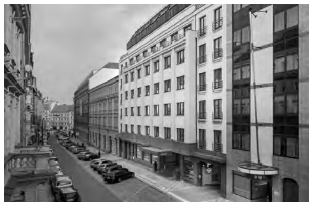
Abb. 7: Während seines Prag-Aufenthalts wohnte Greene im Dachgeschoss des Hotel Alcron, unweit des Wenzelsplatzes.

Dass Greene im Anschluss an seinen ersten Wienaufenthalt ausgerechnet über Prag nach Rom weiterreiste, ist nur ein weiteres Indiz dafür, dass nichts mit rechten Dingen zugeht. Greene hatte den Umweg angeblich nur deswegen eingelegt, weil man damals in die italienische Hauptstadt über Prag fliegen „musste“. Also habe er die „Gelegenheit“ genutzt, um dort seinen Verleger zu treffen und sei so zufällig Zeuge des KP-Putsches am 25. Februar 1948 geworden. 36 Später schrieb Greene etwas scheinheilig: „An dem Abend, als ich Wien verließ, kursierten Gerüchte, dass die Kommunisten die Macht übernehmen würden, mir aber machte mehr das dichte Schneetreiben Sorgen, das den Start des Flugzeugs um Stunden hinauszögerte. Mit demselben Flugzeug reisten zwei englische Korrespondenten, einer arbeitete für eine Agentur, der andere für die BBC. Sie erzählten mir, dass sie unterwegs seien, um über die Revolution zu berichten. ‚Revolution?‘“ 37 Greenes Biograf Shelden lässt das nicht gelten und bezeichnet gleich den ganzen Trip als Tarnmanöver für nachrichtendienstliche Erkundungen. 38