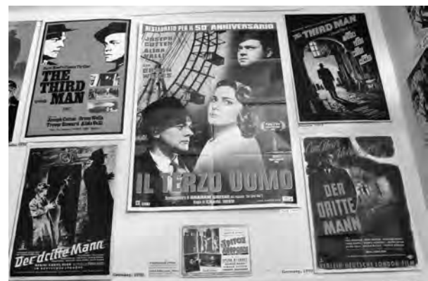
Abb. 1: Verschiedene Filmplakate, ausgestellt im Dritte Mann Museum.

Rennweg-Kaserne soll im Vorzimmer quasi als Hommage ein Plakat von Der dritte Mann hängen. 3