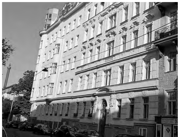
Abb. 15: Heutige Ansicht des Hauses Laufbergstraße Nr. 6.

Ende August 1948 fand eine mehrtägige, streng abgeschirmte Zusammenkunft der KPÖ-Führungsriege Wien-Leopoldstadt statt. In einer unbestätigten Information für die CIA hieß es: „Die Kommunisten planen einen Putsch in diesem Herbst. Die Pläne dafür wurden in einer sowjetisch-requirierten Villa in der Laufbergergasse, 111 Wien II, von 23. August bis 6. September diskutiert. Die Villa war unter konstanter sowjetischer Bewachung. 20 kommunistische Parteimitglieder waren in der Villa präsent. Alle bis auf den kommunistischen Anführer Franz Honner mussten für die Dauer der Sitzung in der Villa bleiben. Uniformierte Sowjets waren ebenso vor Ort. [...] Die finale Phase des Putsches ist es, die Kontrolle über die österreichische Polizei zu übernehmen. Bestimmte österreichische Kollaborateure werden zu diesem Zweck unterwiesen.“ 112 Im österreichischen Innenministerium lag wiederum ein Schriftstück vor, das den Beginn des Treffens um zwei Tage vordatierte: „Die Arbeiten werden unter Aufsicht des Nationalrates Honner, eines gewissen Spanner und Wrebka durchgeführt. Auch Spanner und Wrebka haben Verbot, das Haus zu verlassen, oder sonst irgendwie mit der Außenwelt in Verbindung zu treten. Diese ursprünglich vertrauliche Mitteilung konnte